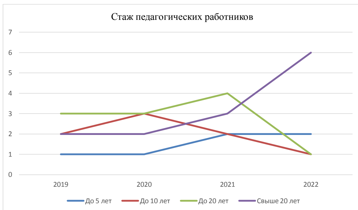
Диаграмма характеристики кадрового состава по стажу.

В целом работа педагогического коллектива детского сада отмечается достаточной стабильностью и положительной результативностью.