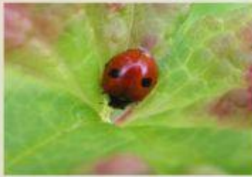
2-точечная божья коровка