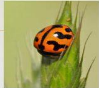
божья коровка из США