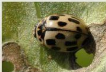
14-точечная божья коровка