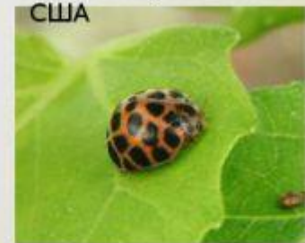
28 -точечная божья коровка

Воспитатель: Предлагаю выучить считалочку про божью коровку.