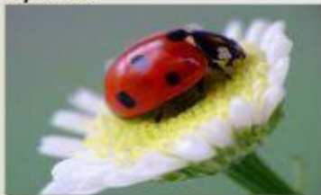
7-точечная божья коровка