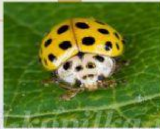
22-точечная божья коровка