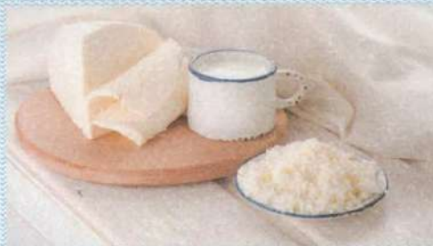
БРЫНЗА (овечий сыр)